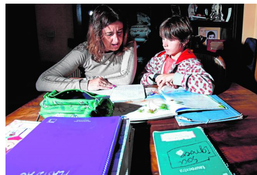
OSCAR DEL POZO

Arancha Ventura «Salen del colegio y no desconectan»